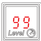
Рис.4 | Рис.4

Для корректной работы индикатора необходимо произвести эталонный замер вмещаемого в баллон газа. Для этого необходимо заправить газом полный баллон, завести двигатель и перейти на газ. Затем нажать на пульте управления одновременно две кнопки и держать до появления звукового сигнала. На индикаторе появится бегающая "змейка" и символ "G" (рис. 3)". Теперь, пока двигатель работает на газе, происходит эталонный замер количества газа в баке. Замер будет продолжаться до полного израсходования газа в баке.