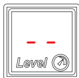
Рис.2 | Рис.2

В программе настройки "TEGAS" должен быть установлен тип датчика уровня газа "Software".