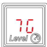
Рис.3 | Рис.3

Завести двигатель и перейти на газ. На индикаторе зажгутся два прочерка.